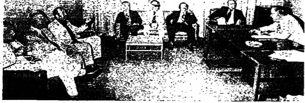
لقاء بين عدد من النواب في إحدى غرف المجلس